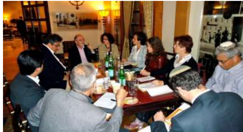
Die Gründungsversammlung im berühmten King David Hotel Jerusalem

Am Sonntag, 3. April 2011 wurde im Hotel King David Jerusalem der neue Verein durch die Gründungsversammlung ins Leben gerufen.